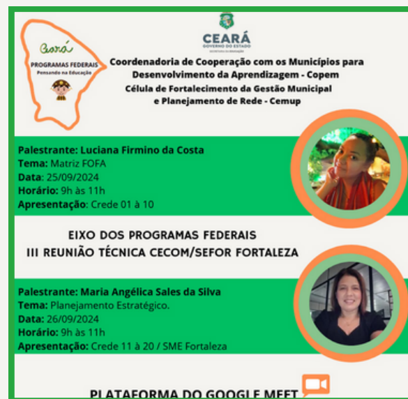
Card da reunião

A reunião deu início ao Fortalecimento de modo equitativo e sistematizado das ações do Eixo, possibilitando que a equipe esteja mais alinhada e apropriada dos processos.